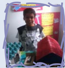
Os vários tipos de moradias e classes sociais fizeram parte da pesquisa