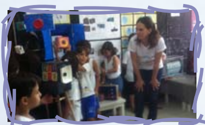
Alunos debatem sobre o que fazer com o lixo eletrônico